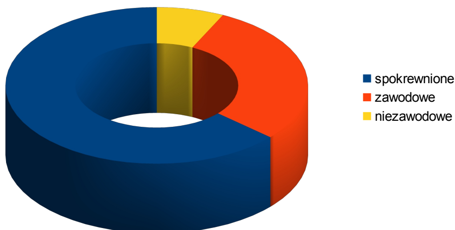
Liczba rodzin zastępczych w 2015 r.

W 2015 roku, na terenie Rudy Śląskiej funkcjonowały 222 rodziny zastępcze, w tym 141 spokrewnionych, 65 niezawodowych i 16 zawodowych.